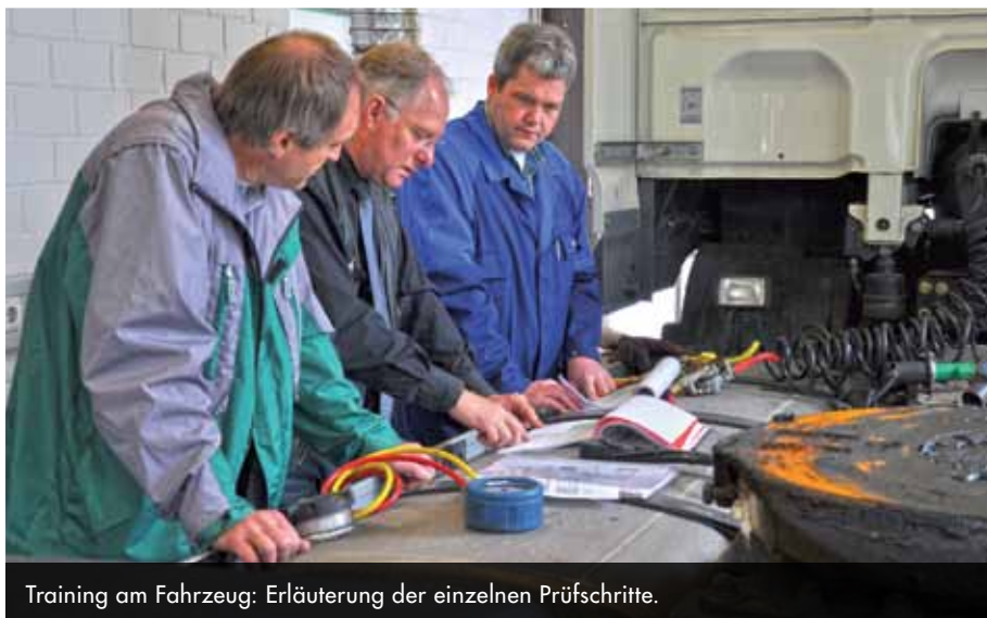
Training am Fahrzeug: Erläuterung der einzelnen Prüfschritte.

Zusammen mit Hinweisen und Empfehlungen fand das Modulverfahren Eingang in die Verfahrensanweisung UN, die von allen Mitgliedern für die UN zu Grunde gelegt wird.