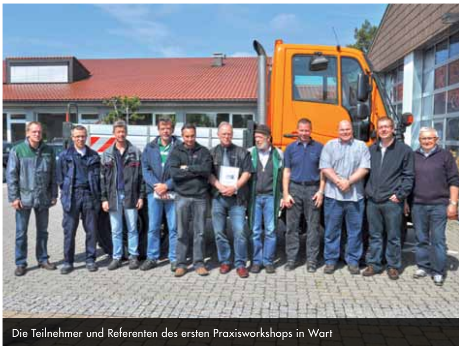
Die Teilnehmer und Referenten des ersten Praxisworkshops in Wart

DEKRA, TÜV Rheinland, TÜV NORD, TÜV SÜD und GTÜ erklärten sich bereit, die Auditoren der einzelnen Regionen einzuweisen. Damit diese Schulungen, die in Ulm, Kreischa, Köln, Michelstadt und Hannover mit einheitlichen Inhalten und Botschaften erfolgen konnten, wurden im Vorfeld noch mal die Referenten zu einem 1 ½ tägigen Workshop in Wart zusammengeholt.